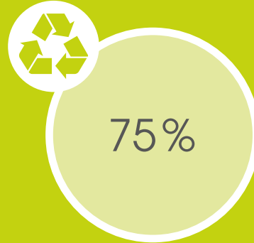
Verantwortung für Verpackungen: Anteil nachwachsender Materialien ii