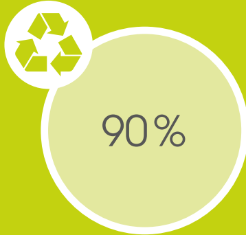
Ressourcennutzung im Betrieb: Recyclingquote