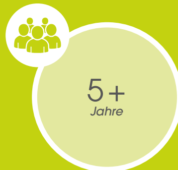
Langfristige Bindung von Fachkräften: Durchschnittliche Betriebszugehörigkeit über beide Standorte