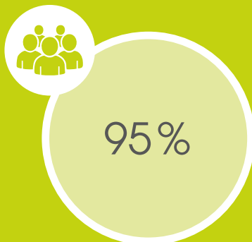
Attraktiver Arbeitgeber: Zufriedenheit unter den Beschäftigten iii